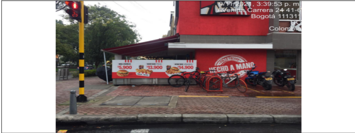
Aviso volado – Avisos adicionales Fotografía No. 3