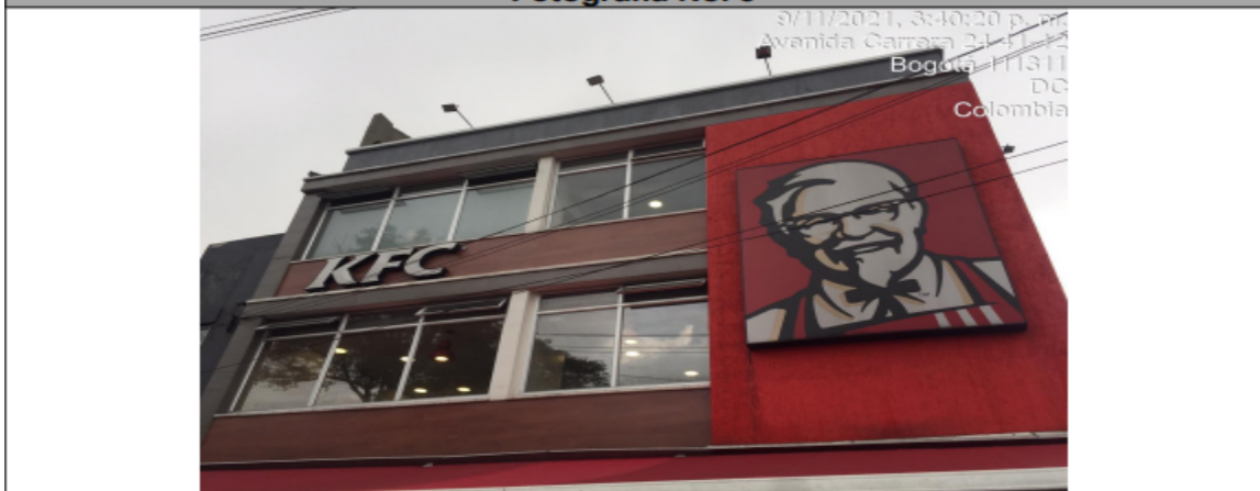
Fachada del establecimiento Orientación visual Carrera